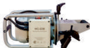
Фаскосниматель ФС22М (220 В)

Максимальные размеры фаски в зависимости от угла