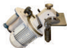
Фаскосниматель ФС10 (220 В)

Максимальные размеры фаски в зависимости от угла