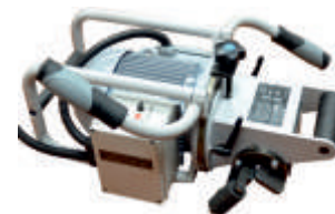
Фаскосниматель ФС26 (380 В)

Максимальные размеры фаски в зависимости от угла